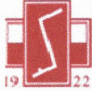
Związek Polaków w Niemczech spod znaku Rodła e.V.